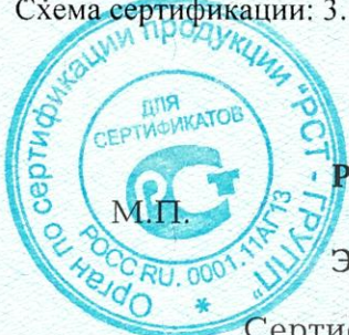
Схема сертификации: 3.